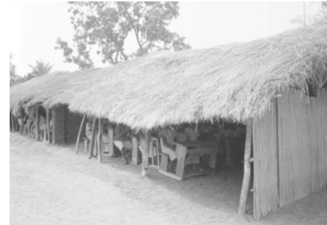
La precedente (sopra) e la nuova (sotto) scuola di Pagalà

Nel gennaio 2008 è in programma la prossima visita in Togo di due nostri rappresentanti.